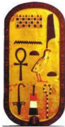
Cartouche de Toutankhamon

l'Association Alphabets sera présente sur le stand n°13