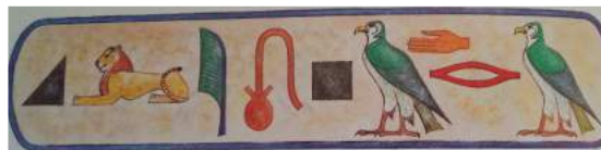
Cartouche de la reine Cléopâtre